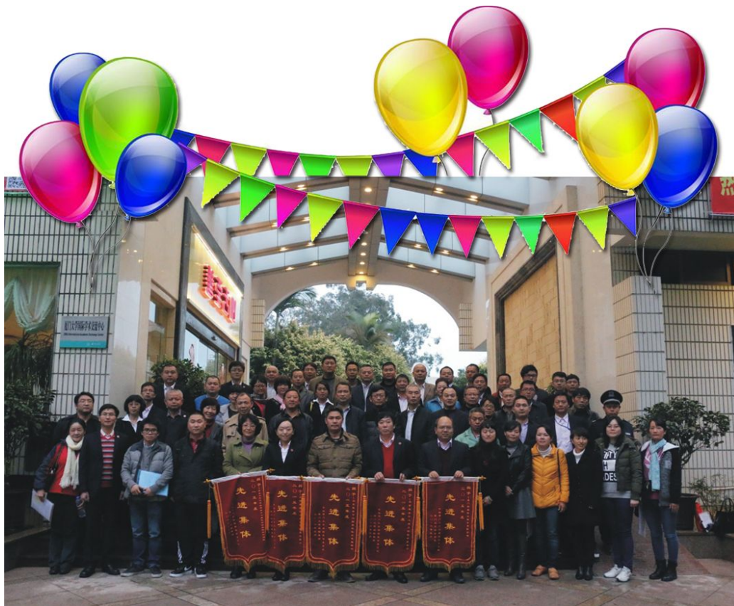
林东伟副书记和集团领导与荣获后勤集团 2015 年度先进集体代表、先进个人合影留念