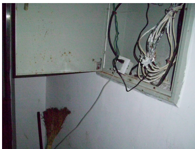
从公共配电箱内私拉的电源线