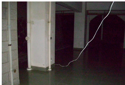
从架空层公共部位私拉的电源线

随着气候转暖,夏季用电高峰期即将来临,安全用电问题应引起各方高度重视,我们将继续不定期进行检查,以确保学生宿舍的用电安全。